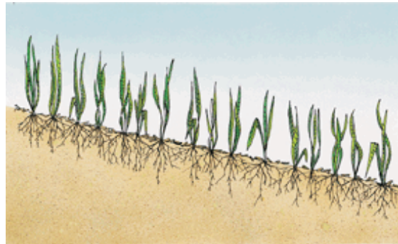
Terza fase, Germogliazione