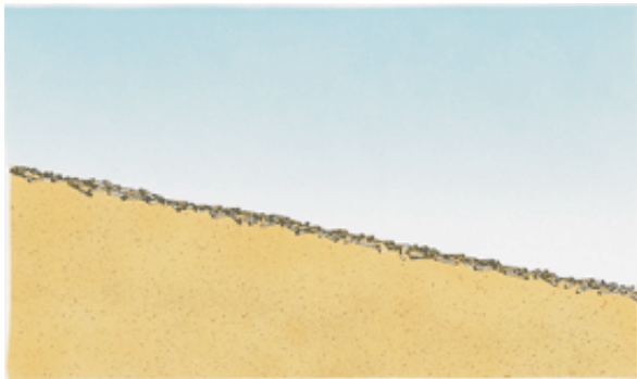
Seconda fase, Semina